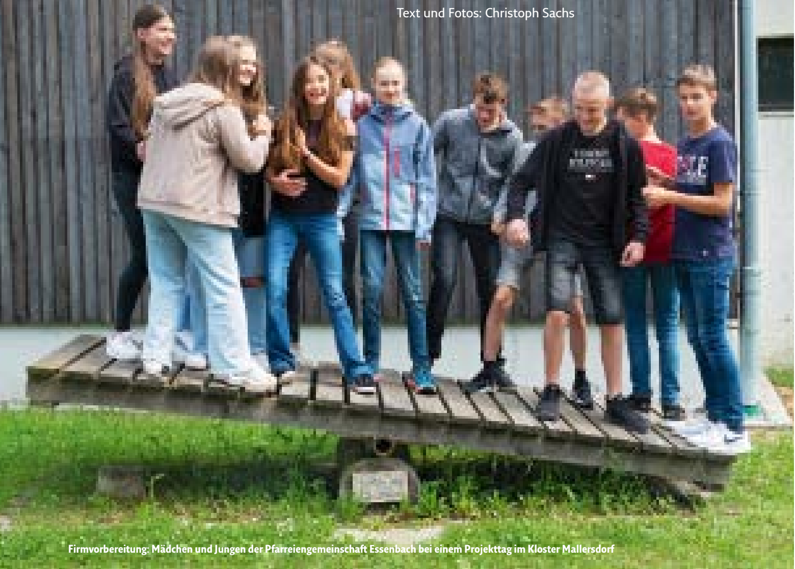
Firmvorbereitung: Mädchen und Jungen der Pfarreiengemeinschaft Essenbach bei einem Projekttag im Kloster Mallersdorf

Kinder und Jugendliche im Glauben zu stärken, ist den Mallersdorfer Schwestern ein Anliegen. Unter anderem bei Projekttagen im Kloster und Angeboten für Firmlinge und ihre Paten geben sie ihre Spiritualität weiter.