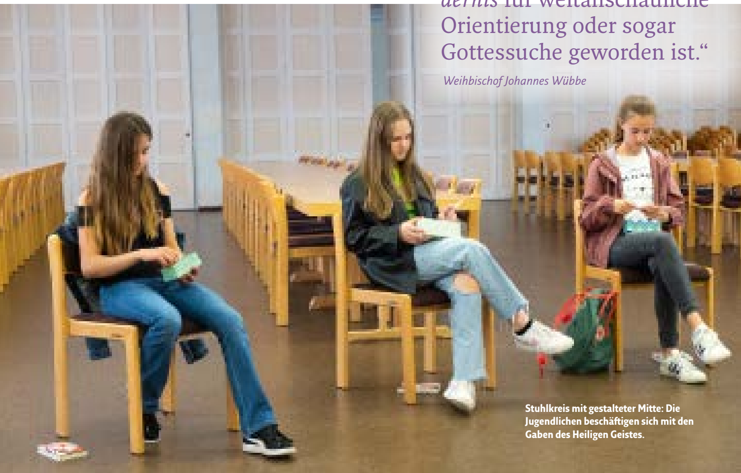
Stuhlkreis mit gestalteter Mitte: Die Jugendlichen beschäftigen sich mit den Gaben des Heiligen Geistes.