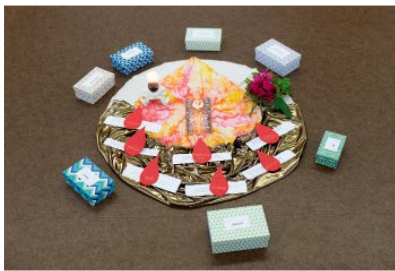
Eine Flamme als Symbol: Die Gaben des Heiligen Geistes sind Thema beim Firmtag.

Die Kirche tut sich heute schwer damit, junge Menschen für den Glauben zu begeistern. Auf der Suche nach tragfähigen Sinn- und Lebenskonzepten inmitten selbstbestimmter Freiheit ist für viele der christliche Glaube alles andere als selbstverständlich und christliche Sozialisation in Familie und Gemeinde für die wenigsten per se gegeben. Wie kann es gelingen, junge Menschen trotzdem zu begleiten und mit ihnen Glaubens- und Lebenserfahrungen zu teilen? IM BLICKPUNKT zeigt Beispiele aus der Arbeit der Mellersdorfer Schwestern.